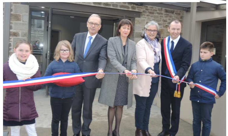
M. le Sénateur, Mme la Sous-Préfète, Mme la Conseillère Départementale et M. le Maire, entourés d'enfants des 2 écoles