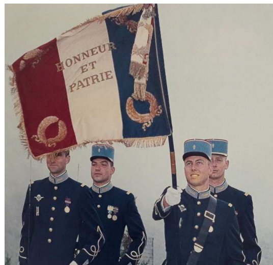
Arnaud Beltrame, lorsqu'il était porte-drapeau de 1999 à 2001 à l'École militaire InterArmes de Saint-Cyr Coëtquidan

Avant de passer du statut "d'homme ordinaire" à celui de "héros de la Nation", Arnaud Beltrame est avant tout un gendarme dévoué à la patrie qu'il chérit et un homme solidaire d'une grande générosité. Ce vendredi 23 mars, il fait face à un homme que la doctrine rend imperméable aux valeurs de liberté, d'égalité et de fraternité qui fondent notre société française. Aveuglé, ce dernier voit le sacrifice ultime comme moyen de convertir les mécréants de sa terre d'accueil. Pour Arnaud Beltrame, la vision est toute autre. Pour lui le sacrifice ultime n'est pas prémédité mais la préservation de la vie d'autrui s'impose à toute autre considération. Se battre contre la haine obscurantiste et la violence extrême constitue une priorité. En ce sens, sa mort est déjà une victoire.