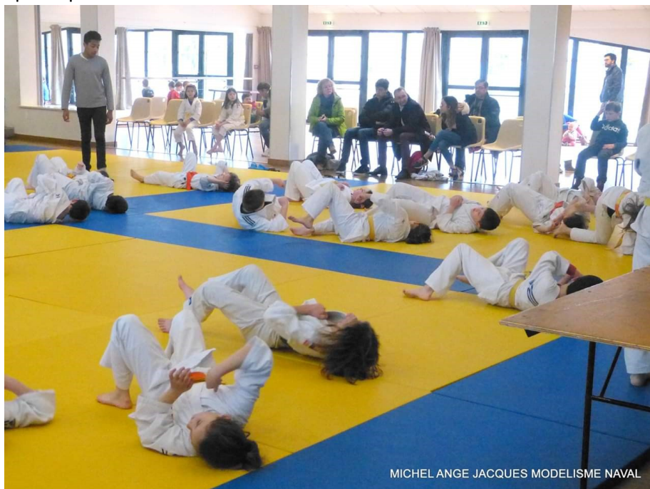
MICHEL ANGE JACQUES MODELISME NAVAL

15h00 à 15h15 : Tournoi par équipes Benjamin(e)s (2007/2008) et Minimes (2005/2006). Les équipes seront composées sur place en fonction du nombre de participants.