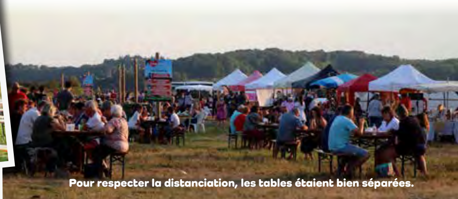
Pour respecter la distanciation, les tables étaient bien séparées.