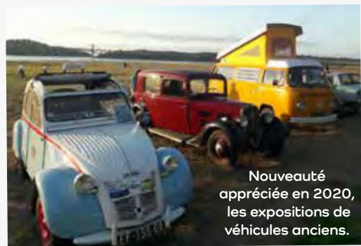
Nouveauté appréciée en 2020, les expositions de véhicules anciens.

Aussi, nous tenons à remercier l'équipe des Vendredis Plage qui a permis de conserver un rayon de soleil estival. Le maintien du marché, comme des concerts, a entretenu une activité appréciable tant pour les exposants que pour les groupes. Des soirées étaient également attendues du public, résidents comme touristes en recherche de moments conviviaux. Ces soirées qui se sont déroulées dans le respect des mesures sanitaires n'ont pu avoir lieu que grâce à la mobilisation des bénévoles de l'association Pleudihennaise des Bords de Rance assistés par la présence d'élus du conseil municipal.