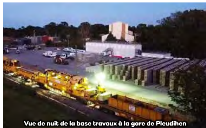
Vue de nuit de la base travaux à la gare de Pleudihen

L'ensemble du chantier consistait à rénover entièrement 18 kilomètres de voie ferrée entre Pleudihen-sur-Rance et Dol de Bretagne.