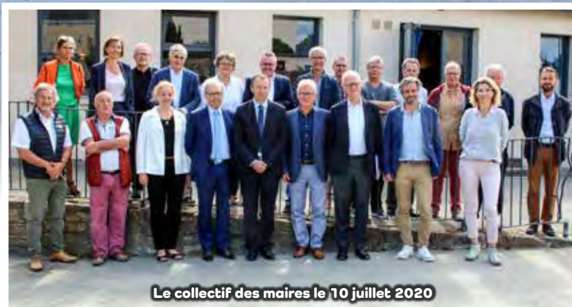
Le collectif des maires le 10 juillet 2020