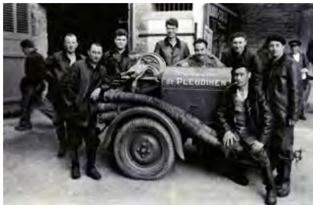
L'ancienne prison fut le premier local, ici en 1954 avec l'équipe autour de la motopompe.

La première compagnie de Sapeurs-Pompiers de Pleudihen est née pour la guerre de 1870, puis dissoute après quelques années. En 1924, le conseil municipal décide de créer un "Service de Secours contre l'Incendie". Le premier local servait à stocker une pompe-à-bras puis la motopompe acquise en 1935. Par la suite, nos Sapeurs-Pompiers vont connaître trois "casernes" qui s'apparentaient surtout à des remises pour stationner le matériel.