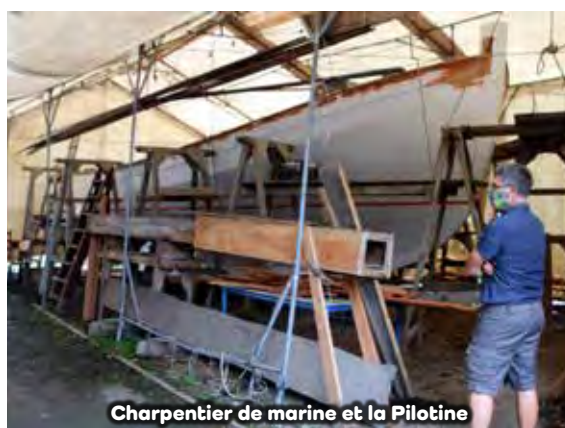
Charpentier de marine et la Pilotine