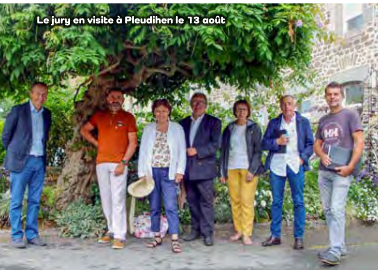
Le jury en visite à Pleudihen le 13 août

Si le CNVVF a été immédiatement séduit par la diversité des paysages et le patrimoine bâti identitaire de la Vallée de la Rance, il a également noté l'activité agricole, notamment la culture du sarrasin et la production d'un cidre réputé, qui contribuent à l'attractivité économique de la commune.