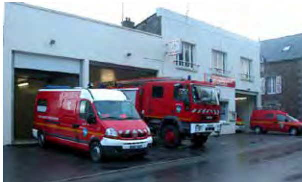
L'actuelle caserne, rue de Dinan, ne répond plus aux exigences liées à l'activité d'un tel Centre de Secours.

La création de la section Jeunes Sapeurs-Pompiers (JSP) en 2003 vient confirmer la nécessité de disposer d'un nouvel équipement. L'effectif se compose actuellement de 18 volontaires résidant sur Pleudihen, St Hélien, La Vicomte et Miniac-Morvan, ainsi que de 12 JSP. Le centre totalise près de 230 interventions sur l'année 2020.