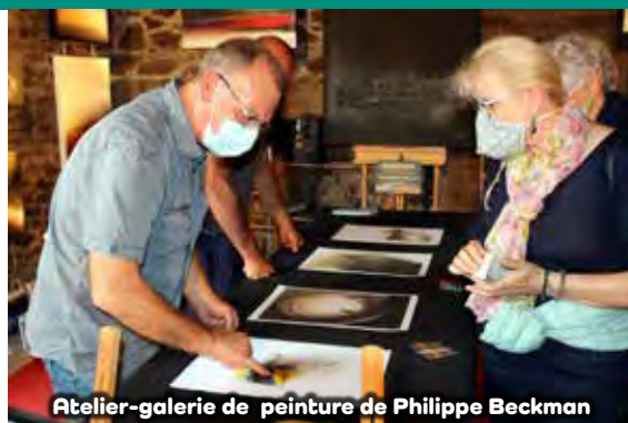
Atelier-galerie de peinture de Philippe Beckman