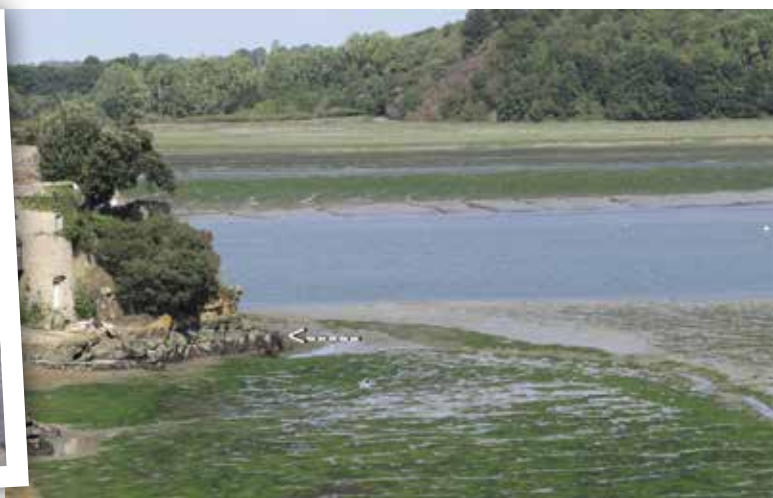
Vues de la Rance près de Mordreuc dans les années 1920 et cent ans après

L'usine marémotrice a bouleversé le site, mais créé aussi une situation inédite du point de vue gouvernance. Par convention, en 1968, l'État propriétaire du Domaine Public Maritime (DPM) de l'estuaire, a concédé l'exploitation à EDF pour une durée de 75 ans soit jusqu'en 2043.