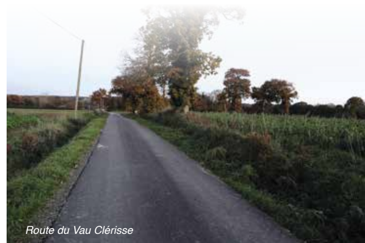
Route du Vau Clérisse

Comme chaque année, dans le cadre des engagements avec Dinan Agglomération, des travaux ont été réalisés sur la commune pour l'entretien de notre voirie. Cette année, le secteur de la gare et la route VC3 allant du calvaire Beaumarchais situé route de Mordreuc jusqu'à la sortie de la Gravelle vers la plage de la Ville Ger ont bénéficié d'une remise en état avec un enrobé. Quant à la voie menant au Vau Clérisse, des travaux plus importants étaient nécessaires : reprofilage, renforcement et enrobé, sur cette voie qui dessert maintenant cinq maisons.