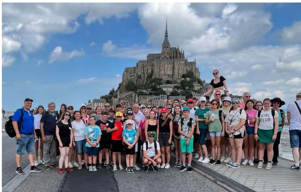
Ce jeudi 17 août, le groupe mélangé jeunes allemands et français devant "la Merveille".

Es lebe die deutsch-französische Freundschaft!