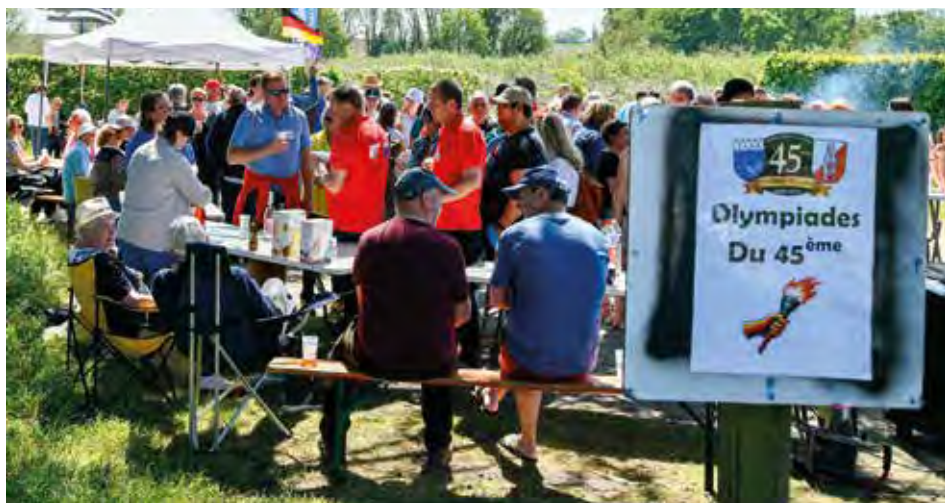
Jumelage à La Ville Ger en mai 2024

2024 fut à nouveau une année riche en échanges avec nos amis allemands.