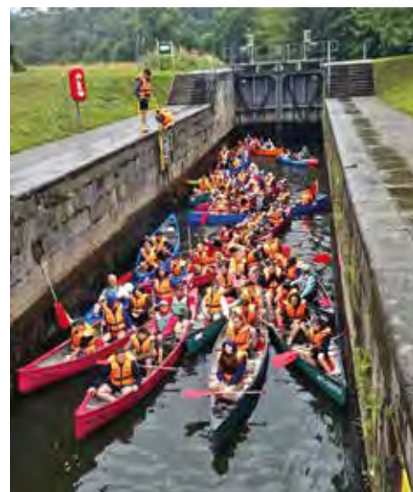
Les ados du jumelage à Herschbach

Quant au séjour des jeunes allemands, il aura lieu du 16 au 26 juillet à Pleudihen.