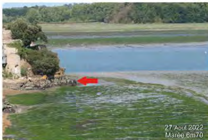
Au phénomène de sur-sédimentation, s'ajoute depuis quelques années une prolifération « d'algues vertes sur vasière ». Pour rappel, Avant la fermeture artificielle de l'estuaire par l'usine marémotrice (1961) la plaine de Mordreuc (photo) était une immense étendue de sable (!).